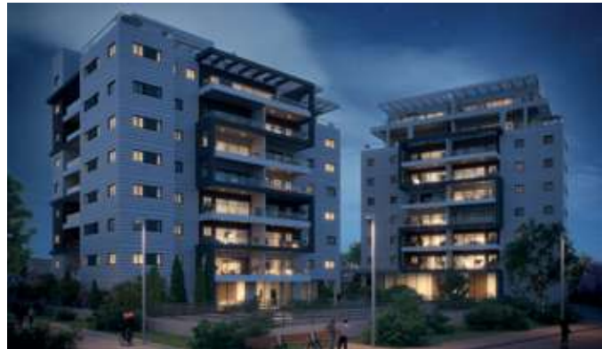
שוסטר מול הפארק, הרצליה