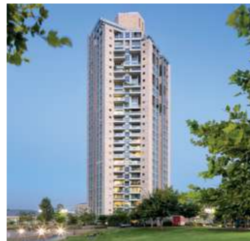
מגדל הפארק, גבעתיים